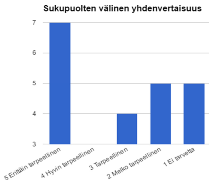
Taulukko 1 Sukupuolten välinen yhdenvertaisuus SLKL:n toiminnassa.

erittäin tarpeellista. Puolestaan kymmenen oli sitä mieltä, että tälle ei ole tarvetta tai se olisi melko tarpeellista.