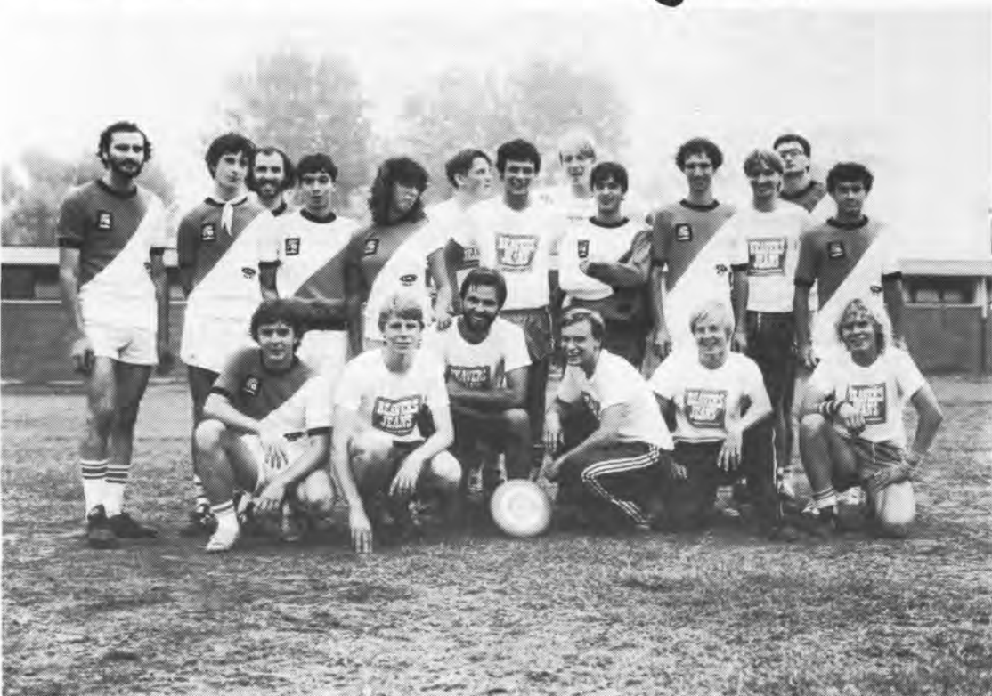
KUVA: Frisbee Sport Italia

Ruotsi todisti jälleen olevansa Euroopan huippumaa. Vakuuttavalla tavalla se otti sekä Ultimaten että Gutsin Euroopan mestaruuden. Yhteiskilpailuissa oli Ruotsi ykkönen täysillä pisteillä. Toisena oli Suomi, Ultimaten kolmonen ja Gutsin kakkonen. Muut maat olivat: Italia, Itävalta, Belgia, Iso Britannia, Sveitsi ja Ranska.